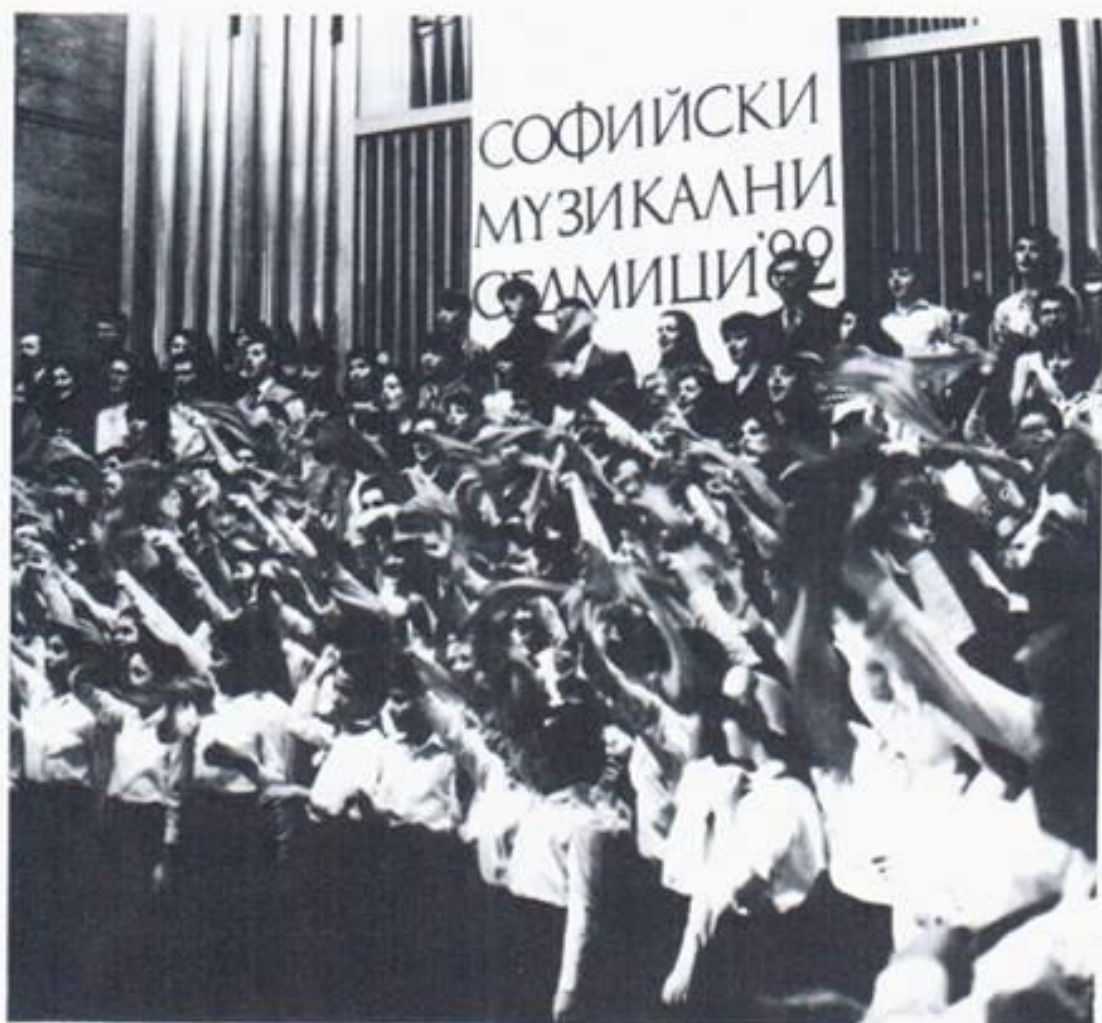
9. Концерт по случаю 35-летия хора. В исполнении последней песни приняли участие бывшие члены хора.