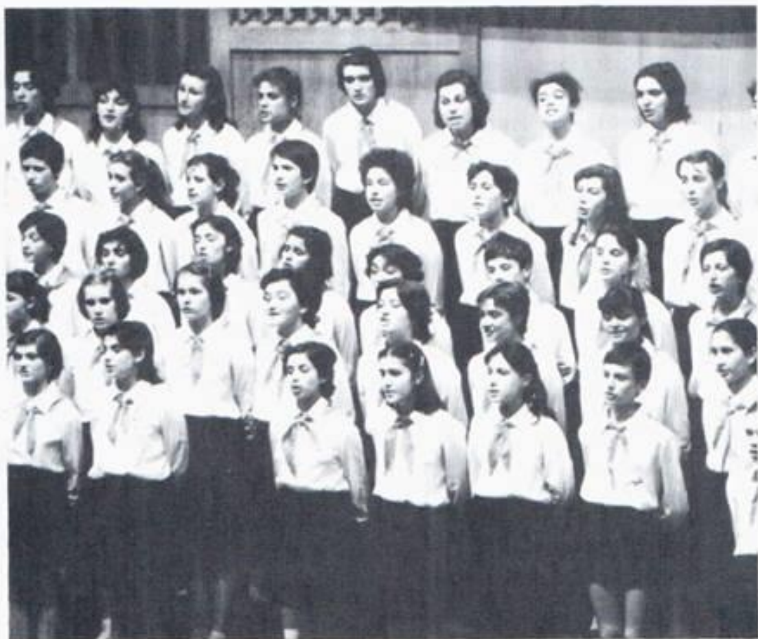
Дмитрий Кабалевский приветствует членов хора.