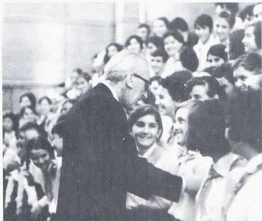
Композитор Тодор Попов среди пионеров хора „Воорая смена”.