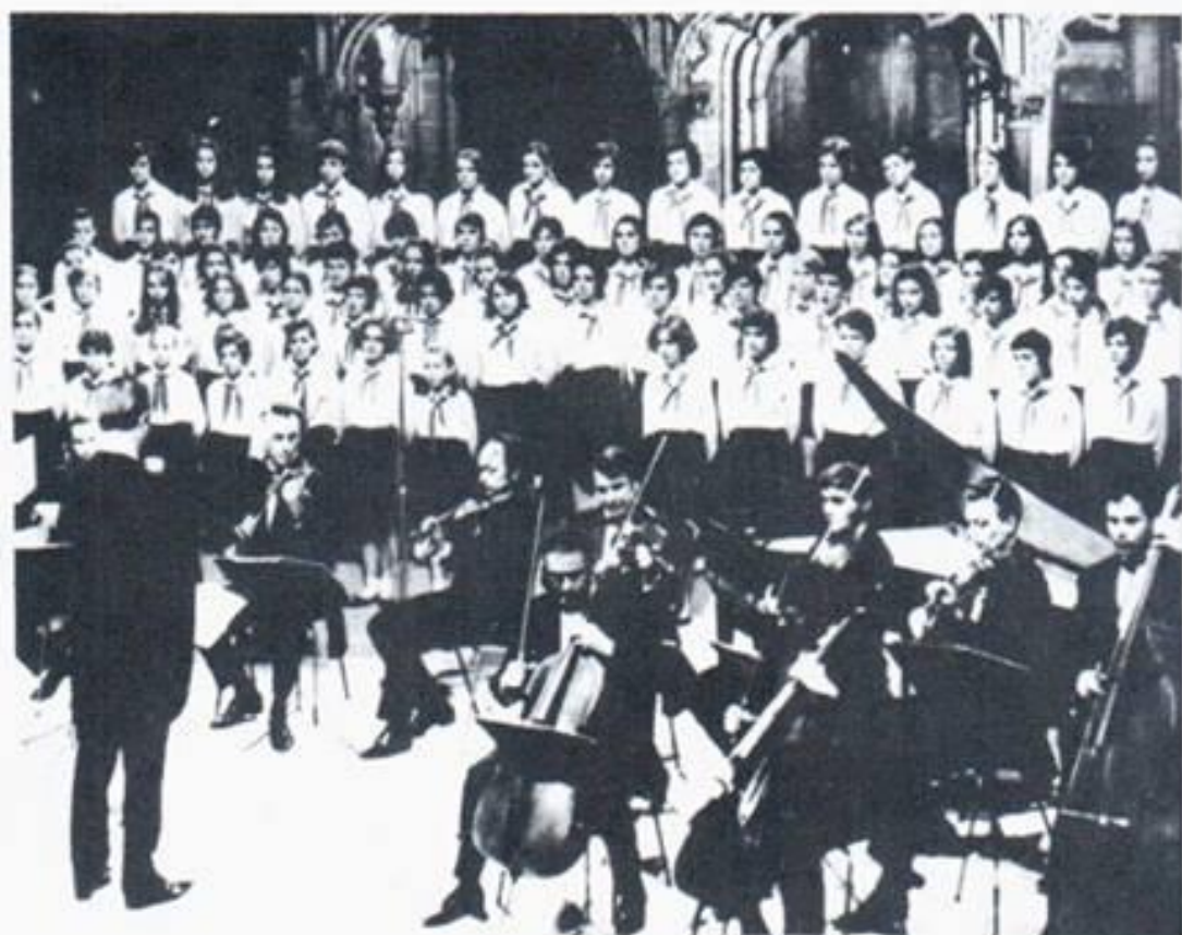
7. 1971 год. Совместный концерт хора и камерного оркестра „Софийские солисты“ в соборе св. Петра в Бриттен (Англия)